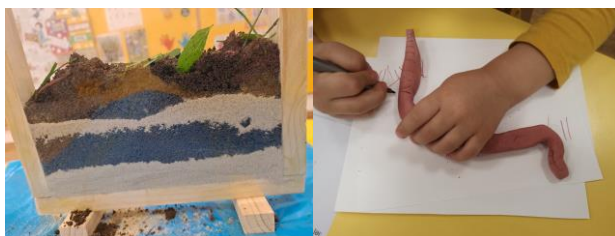
Bivališče za deževnika – skupina Čebelice