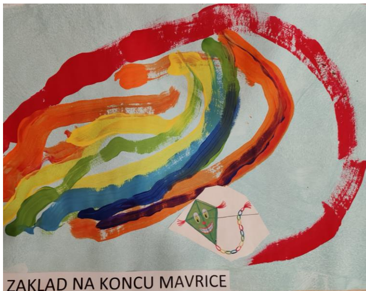
ZAKLAD NA KONCU MAVRICE