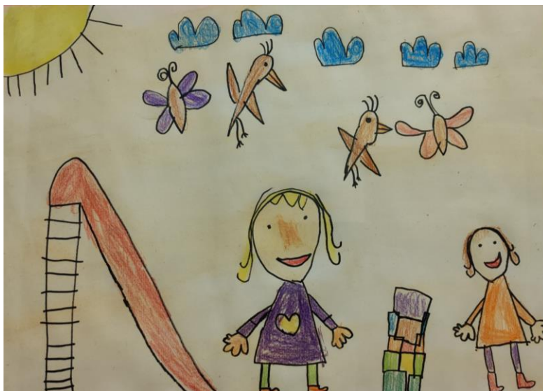
Igra s prijatelji – Julia, 5 let