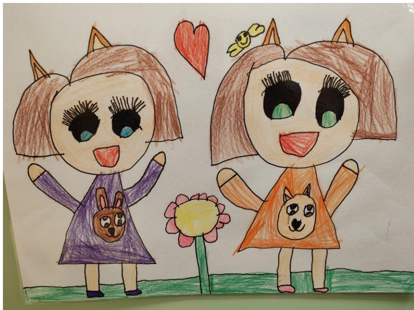
Moja prijateljica – Ela, 6 let

Stroške za izvedbo dodatnih dejavnosti križete starši sami.