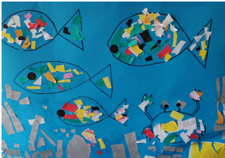
Zgodba: Mali rakec, skupinsko delo

Naša vizija je ustvarjati kakovosten vrtec z zadovoljnimi otroki, starši in zaposlenimi.