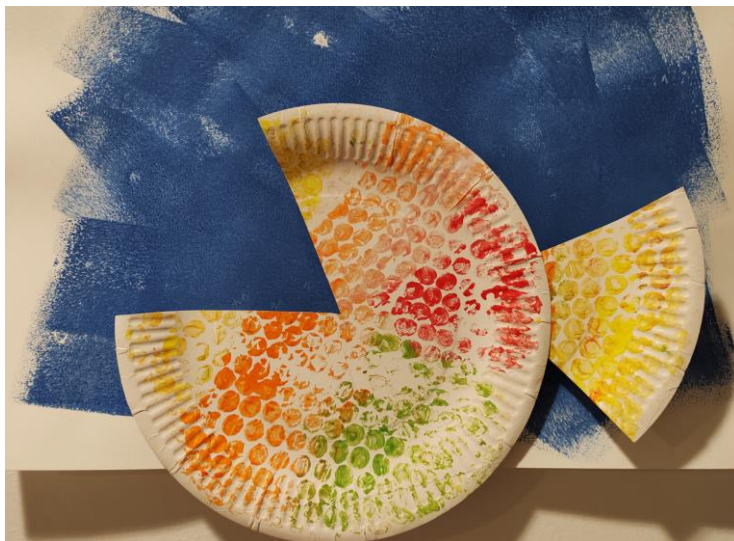
Ribica – Sara, 2 leti

Izraz porajajoča se pismenost poudarja, da je opismenjevanje postopen in dolgotrajen proces ter zajema večji del predšolskega obdobja. To je čas v razvoju otroka med najzgodnejšo pismenostjo, ko otrok čeečka in se pretvarja, da bere, ter poznejšim učenjem branja in pisanja v šoli.