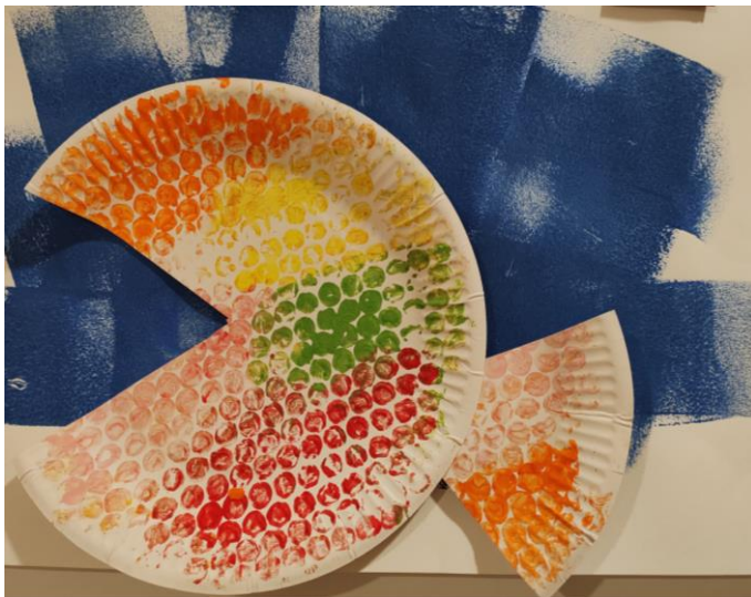
Ribica – Amadej, 2 leti