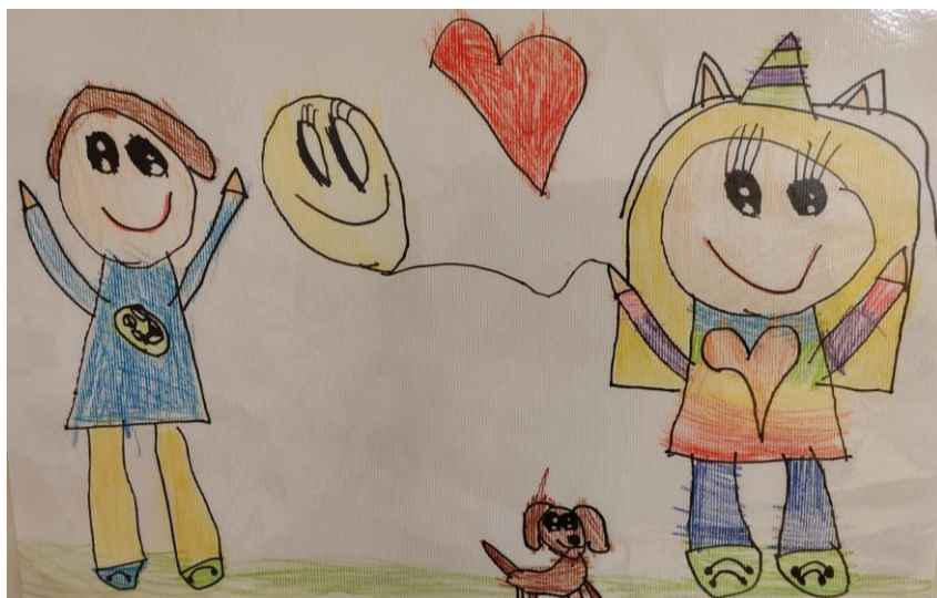
Prijateljstvo -Sofia, 6 let