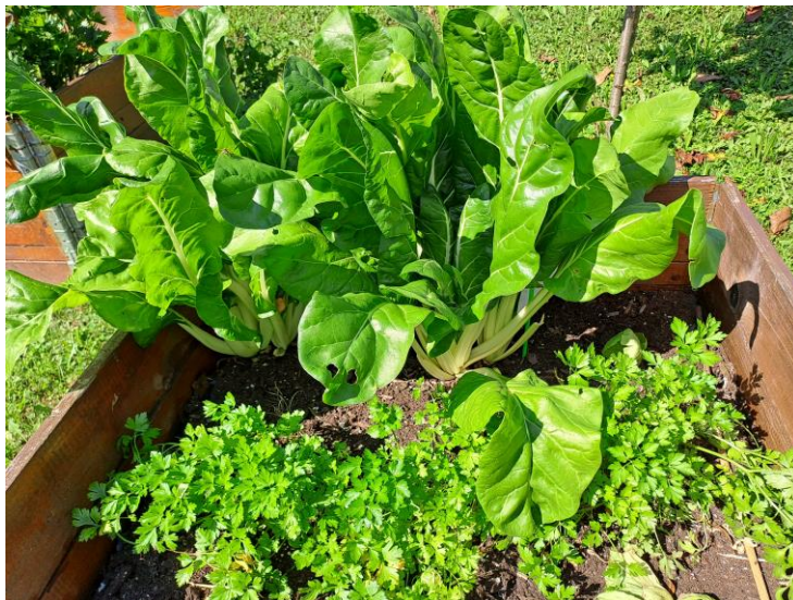
Naš eko vrt

O načinu praznovanja rojstnega dne , se boste dogovorili na prvem roditeljskem sestanku.