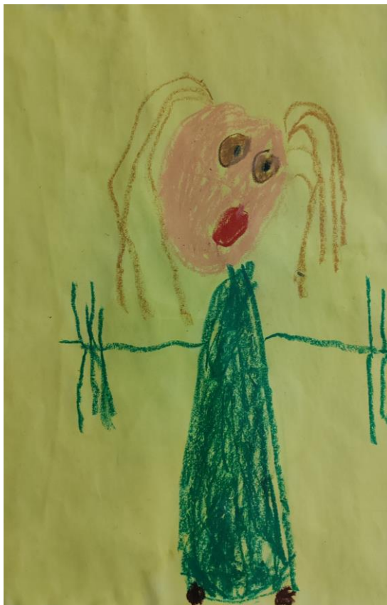
To sem jaz – Zoja, 3 leta

Topli zimski kombinezon dopušča, da se otrok »podriča« tudi po zadnji plati. V nahrbtnik naj starši ne pozabijo shraniti rezervna oblačila.