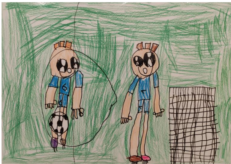
Nogometno igrišče – Alek, 6 let

Projekt poteka pod okriljem Zavoda za zdravstveno varstvo in omogoča otrokom, da se seznanijo z osnovnimi informacijami o tem, kako skrbimo za svoje zdravje. Vzgojiteljem pa Zavod nudi strokovno podporo in stalna strokovna izobraževanja. Otroci se preko konkretnih izkušenj in situacij učijo o pomenu zdrave prehrane, usvajajo veščine osebne higiene in spoznavajo pomen gibanja in počitka za delovanje človeškega telesa. Vso pridobljeno znanje pa bo otrokom služilo kot vodilo k zdravemu načinu življenja tudi v osnovnošolskem obdobju in kasneje, ko bodo odrasli. Z lastnim zgledom bomo našim otrokom vzor pri oblikovanju zdravega načina življenja.