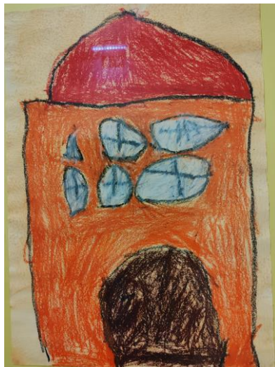
Moja hiša – Ajda, 3 leta