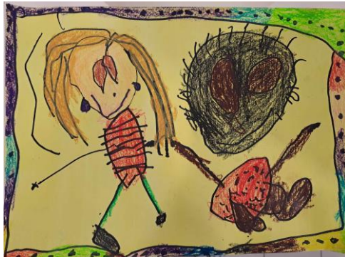
Likovni natečaj na temo: Drugáčnost – Mia, 4 leta

Otrokom zagotavljamo spodbudno, varno, razumevajoče in zdravo okolje za njihov telesni, duševni in socialni razvoj na osnovi pozitivnih čustev. Vzgojno delo z otroki načrtujemo izhajajoč iz poznavanja in razumevanja njegovega razvoja v določenem starostnem obdobju in iz sposobnosti posameznega otroka. Otroke varujemo pred telesnim nasiljem drugih otrok ali odraslih.